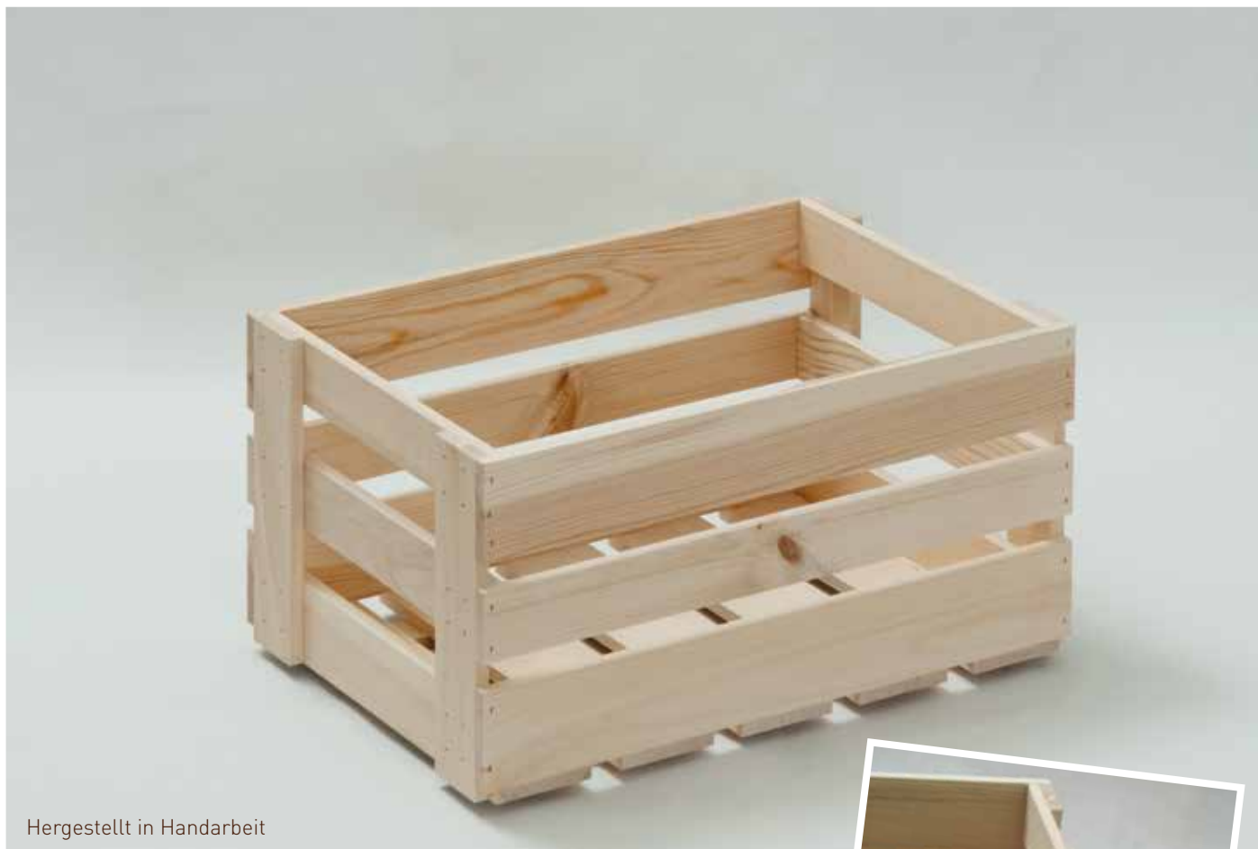
Hergestellt in Handarbeit