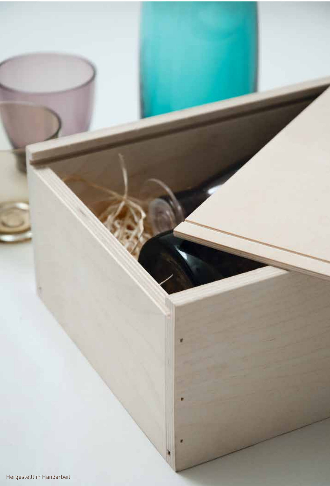
Hergestellt in Handarbeit